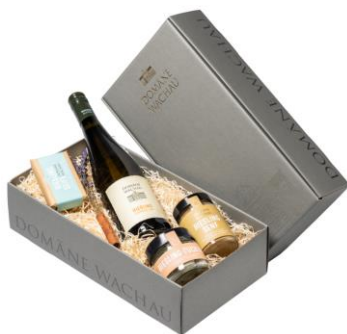
Krabice papírová zavírací Cena: 90,-Kč bez DPH 109,-Kč s DPH