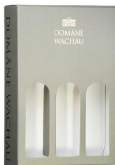
Krabice papírová s výřezy Cena: 123,-Kč bez DPH 149,-Kč s DPH