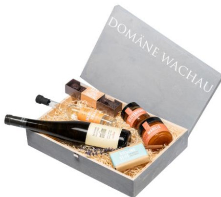
Dřevěná zavírací krabice na 3lahve Cena: 206,-Kč bez DPH 249,-Kč s DPH