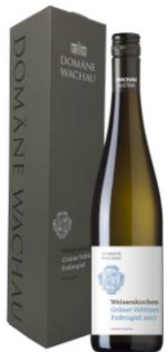
Krabička kartonová Cena: 49,-Kč bezDPH 59,-Kč s DPH