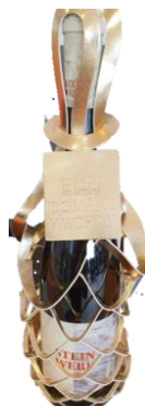
Zlatý obal Cena: 82,-Kč bez DPH 99,-Kč s DPH