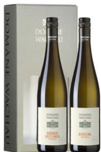
Krabice papírová s výřezy Cena: 82,-Kč bez DPH 99,-Kč s DPH