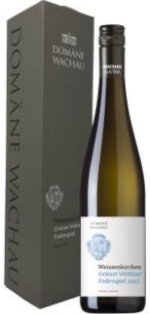
Krabička kartonová Cena: 49,-Kč bezDPH 59,-Kč s DPH