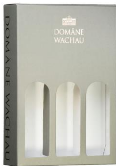
Krabice papírová s výřezy Cena: 123,-Kč bez DPH 149,-Kč s DPH