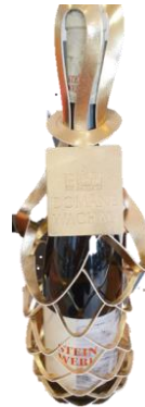
Zlatý obal Cena: 82,-Kč bez DPH 99,-Kč s DPH