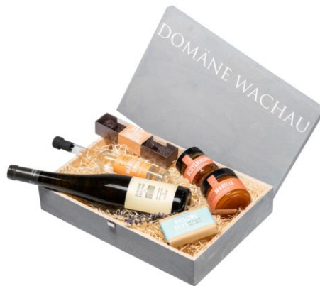
Dřevěná zavírací krabice na 3lahve Cena: 206,-Kč bez DPH 249,-Kč s DPH