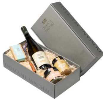
Krabice papírová zavírací Cena: 90,-Kč bez DPH 109,-Kč s DPH