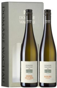
Krabice papírová s výřezy Cena: 82,-Kč bez DPH 99,-Kč s DPH